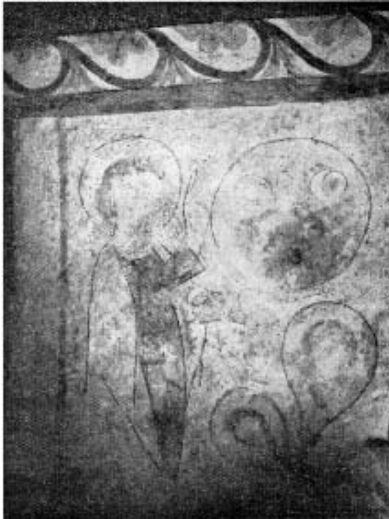
Abb.2. Die Schöpfung, erstes Bild der oberen Reihe der Nordwand (restauriert)

landes eindringlich vor Augen führen sollen. Der diese Bilder allseits einrahmende Fries zeigt als Hauptmotiv rote ineinander geschobene herzförmige oder lindenblattähnliche Figuren, die mit blauem geripptem Blattwerk