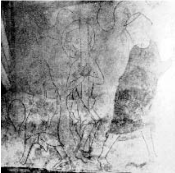
Abb. 6. Das erste erhaltene Bild der unteren Reihe der Nordwand die Geißelung (restauriert)

erinnert an ornamentale plastische Aufteilungen von frühchristlichen Sarkophagen und ist in dieser plastischen Form auch in frühen italienischen Darstellungen bei Krippen oder Grabesbildern zu finden. Da diese Flächenbehandlung auf mehreren Bildern wiederkehrt, kann sie als typisch für unseren Maler angesehen werden. Die mangelnde Naturbeobachtung wird durch eine wohl schematische, sich in den übrigen Linienrhythmus aber sehr gut einfügende Zeichnung und Bemalung in unbewusster Fortführung alter Traditionen aus frühchristlicher Zeit ersetzt. Das Fehlen jeder naturwahren Darstellung in der Umgebung der Figuren und das starke Betonen des kubisch körperlichen am Krippentroge oder später am Grabe« läßt die dargestellten Personen in ihrer Haltung und dem Linienspiel der Gewandung um so eindringlicher erscheinen.