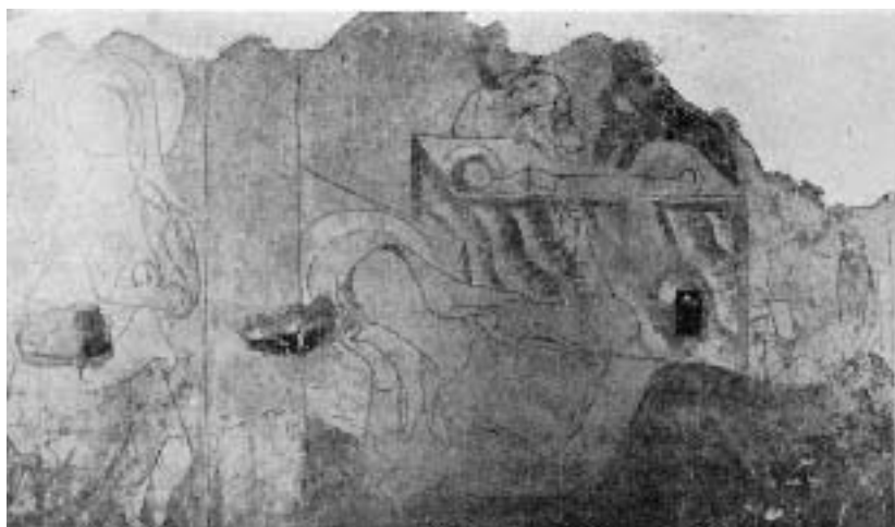
Abb. 5. Ain linken Rande Teil des Kindermordes, die Gestalt des Herodes) daneben die Flucht nach Ägypten (vor der Restaurierung) achttes und neuntes Bild der oberen Reihe der Nordwand

Gleich trefflich wirkt der große ruhig liegende Körper Marias im nächsten erhaltenen Bilde, der Geburt Christi im Stalle zu Bethlehem. Maria hat den linken Arm erhoben und ergreift damit die Hand des Neugeborenen, die dieser aus der Krippe herüberreicht. Die ganze Haltung Mariens wie des Kindes und die zu beiden Figuren nicht passenden Armhaltungen beweisen, daß der Künstler nach einem Vorbilde mit liegenden Armen arbeitete, das er durch das Ausheben und Ineinanderlegen der beiden Hände lebendiger und inniger gestalten wollte. Wir