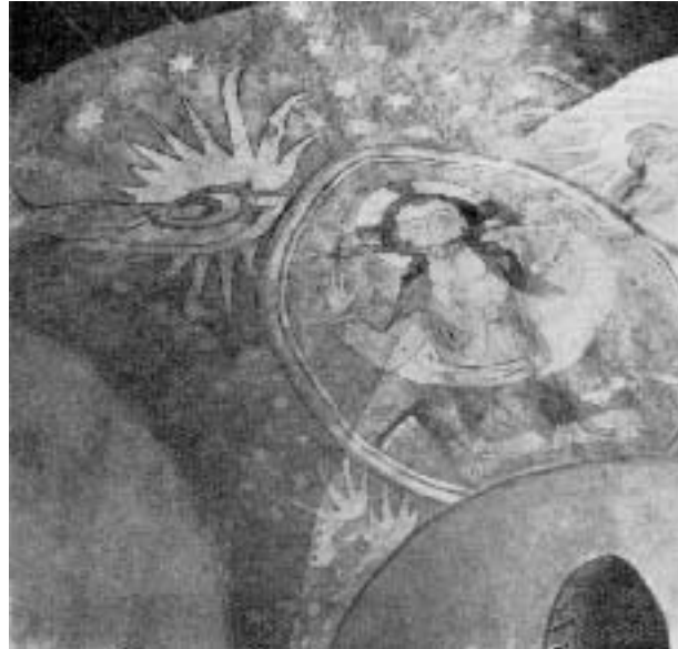
Abb. 8. Bemalung des Chorgewölbes nach der Restaurierung

des Körpers, sowie die beiden seitlichen Figuren Maria und Johannes gelungen. Leider fehlen zum Teil die Hände, nur die ein Buch haltende Linke ist bei Johannes noch vorhanden. Das Linienspiel der Gewandung und die leicht nach gotischer Art