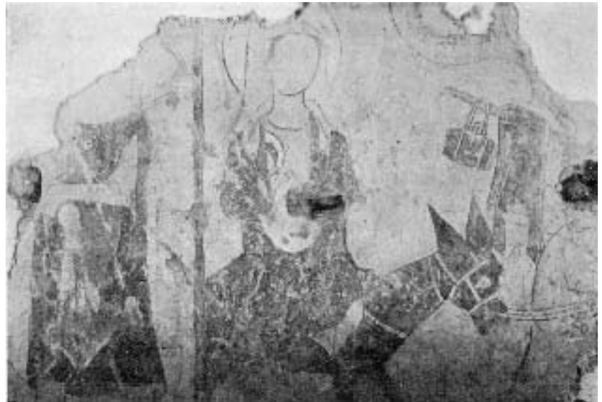
Abb. 4 Ain linken Rande Maria Empfängnis (rechtes Ende der Darstellung), daneben Christi Geburt (vor der Restaurierung) fünftes und sechstes Bild der oberen Reihe der Nordwand