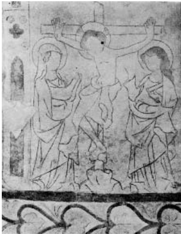
Abb 7. Ein Teil des zweiten (linker Rand) und das dritte erhaltene Bild der unteren Reihe der Nordwand, die Kreuzigung (restauriert)

Um so besser hat sich die Szene der Flucht nach Ägypten freilegen lassen (Abbildung 5). Maria sitzt auf dem Esel und hält den Jesusknaben zu dreiviertel unter dem Mantel verborgen. Die sitzende Figur zeigt schöne ruhige Haltung. Köstlich ist das ruhig trabende Grautier mit seinen langen Ohren, fein aufgezümt, wiedergegeben. Der Hinterteil des Esels ist durch die Streifenteilung abgeschnitten, auch von dem voranschreitenden Josef fiel ein gut Teil dem einrahmenden Fries zum Opfer, ein Beweis wiederum, daß der Maler ein Vorbild verwendete, das wie aus anderen Szenen auch zu sehen ist, an seinem