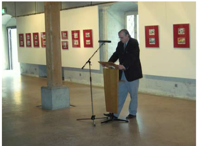
Der Laudator bei seiner Ansprache zur Ausstellungseröffnung