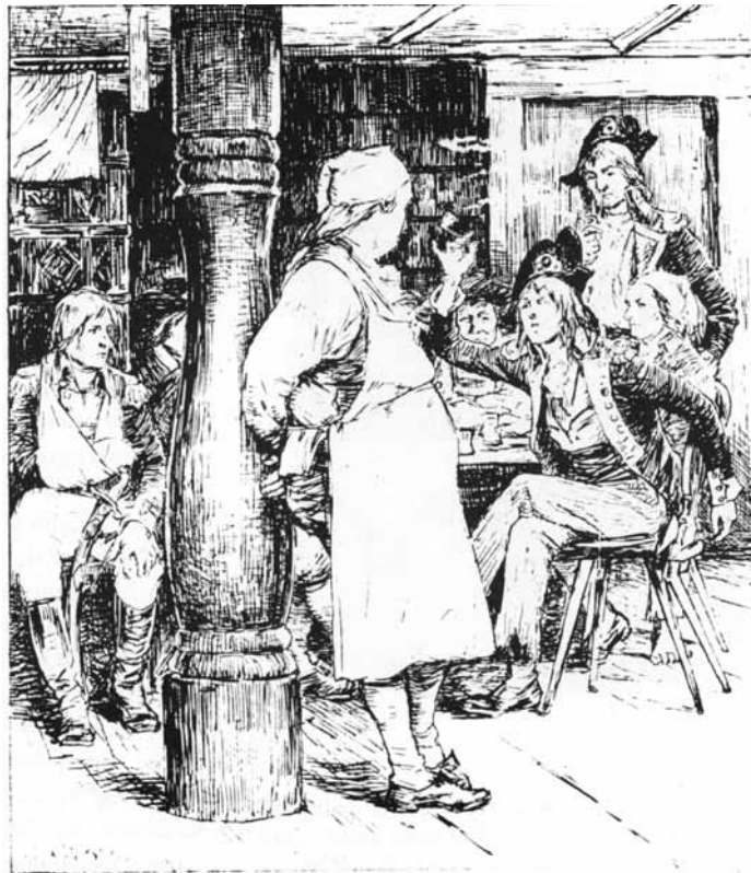
Hansjakobs Großvater der „Eselsbeck von Hasle“. Von ihm erbte er sein demokratisches Blut. Illustration von Curt Liebich zu Hansjakobs „Schneeballen“ 2. Reihe

deutschen, besonders die Alemannen, heute im Staub vor den Preußen und äfften ihnen alles nach „in Sprache, Schule, Titularen und — in Servilismus“52). Seit Preußen die Führung in Deutschland übernommen habe, nähmen der Untertanengeist und die Servilität immer mehr zu. Knecht selige, Servile, Wedler, Manteldreher, Byzantiner gebe es in Deutschland nun in Hülle und Fülle, „aber das Byzanz dieser Leute liegt jetzt nicht mehr am Bosphorus, sondern an der Spree..“53). Mutige Worte aus dem Munde eines katholischen Pfarrers, der sich selbst „religiös und politisch als Ketzer“54), als Schriftsteller mit einer „scharfen demokratischen Zunge“55) sah und der wegen seiner politischen Überzeugung zweimal im Ge-