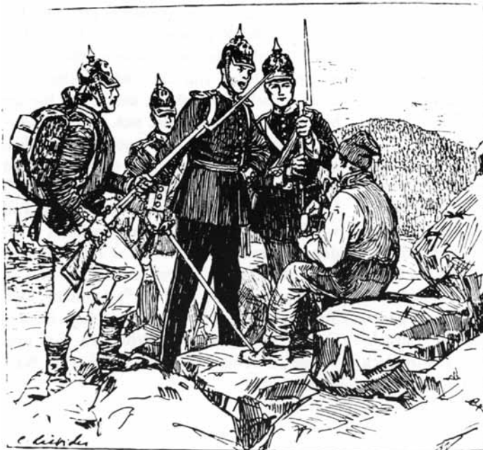
1849 rückten preußische Soldaten ins Kinzigtal ein. Damals, wurde Hansjakob Preußengegner. Illustration zu Hansjakobs, „Wilde Kirschen“