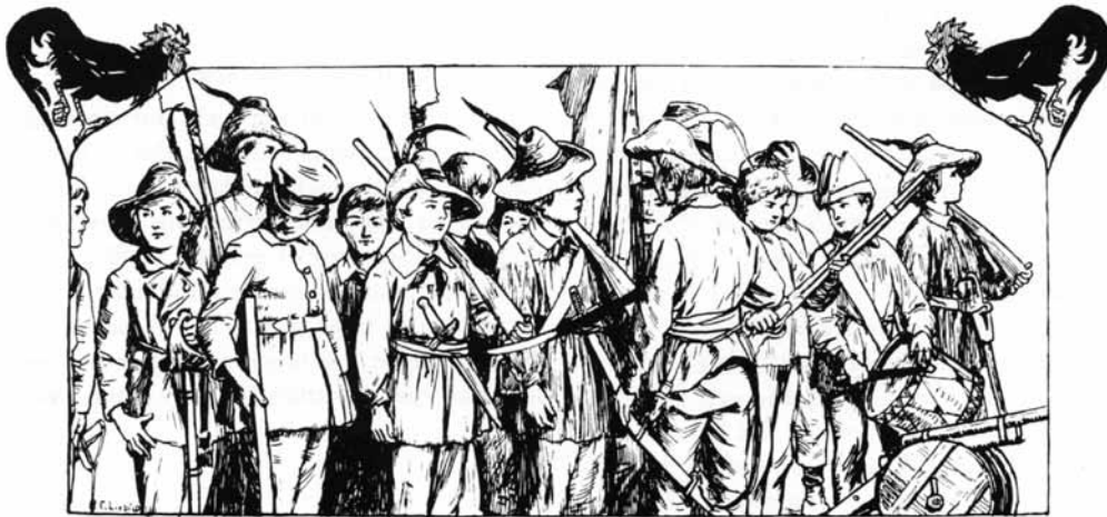
Die Haslacher Buben mit ihren „Heckerhüten“. Illustration von Curt Liebich zu Hansjakobs „Aus meiner Jugendzeit“

Schon gegen Ende des 19. Jahrhunderts sah Hansjakob den Wald gefährdet. Eine Gefährdung des Waldes war für ihn auch eine