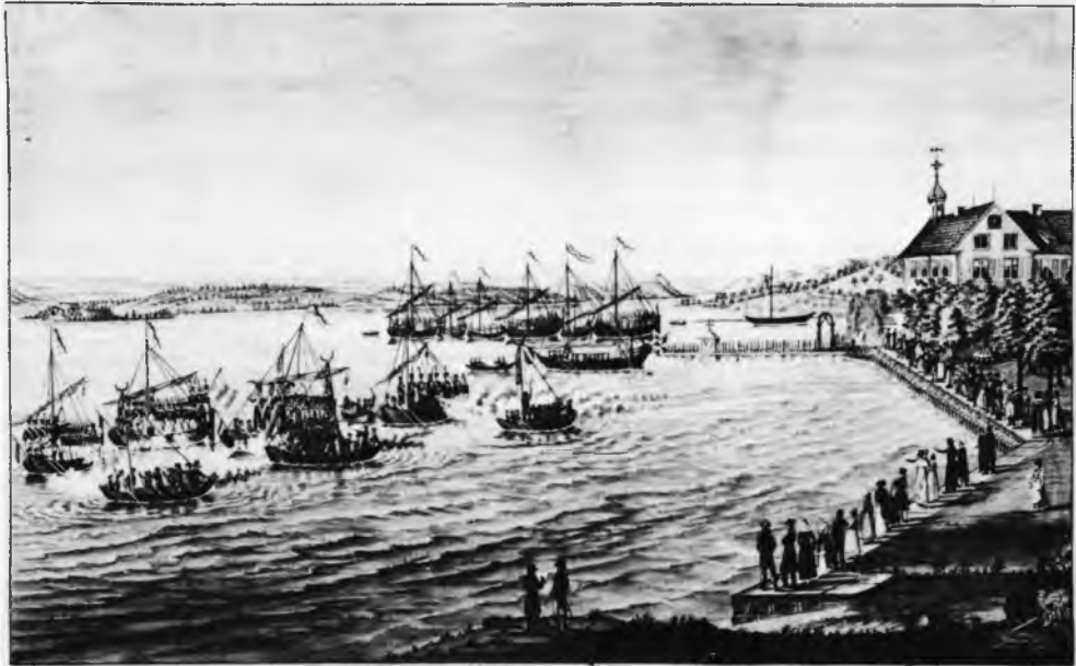
Sicht von dem Schloß Maurach in Überlingen Jubel über die Ankunft S. K. H. des Durchlaucht. Großherzog von Baden geführt am Becken des 25. Sept. 1819 zwischen Maurach u. Mayrau...