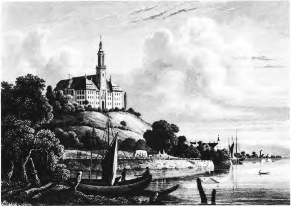
Die Wallfahrtskirche Neubirnau und das Schloß Maurach. Stahlstich von J. Poppel in E. Huhns Beschreibung des Großherzogtums Baden von 1850

kannt wurde, daß Händler aus dem ober-schwäbischen Hinterland unter Umgehung des Überlinger Markts, Hafens und der landesherrlichen Zollstelle Getreide von Maurach aus in die Schweiz verkauften, schlugen der großherzogliche Oberamtmann in Überlingen und der Stadtrat erneut Krach. In einer gemeinsamen Erklärung warnten sie die Regierung vor dem aufstrebenden Handel Württembergs über den Bodensee. Allein der Überlinger Markt war ihrer Meinung nach in der Lage, ein wirksames Gegengewicht zu bilden. „Die äußerste Anstrengung der Krone Württemberg, allen Fruchthandel an sich zu reißen und vorzüglich den hiesigen zu vernichten, und die in dieser Absicht erst neuerlich geschehene Errichtung des freyen FriedrichsHafens müssen uns umso aufmerksamer auf Erhaltung des Marktes machen. Die großen Nachtheile, welche aus der Zer-