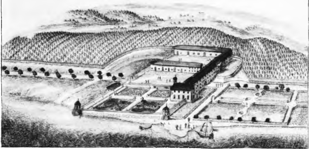
„Das Schloß Maurach um 1730. Darstellung eines unbekanntem Kupferstechers im Stadtarchiv Überlingen. Während die Haupt- und Ökonomiegebäude und das Backhaus an der Mauer heute noch weitgehend erhalten sind, existieren die Pavillons, die kunstvollen Gartenanlagen und die Baumallee in Richtung Überlingen nicht mehr.“

Als sich das 12. Jahrhundert seinem Ende zuneigte, hatte Salem das Anfangsstadium seiner wirtschaftlichen Entwicklung hinter sich. Im näheren Umkreis des Stifts war die Bildung der Grangien Forst, Schwandorf, Fessenried, Mendlishausen, Banzenreute und Maurach gelungen, wobei letzterer wegen ihrer Lage am See und dem Weinbau ein besonderer Stellenwert zukam. Weitere Höfe, so Kirchberg, waren bis 1350 errichtet, alle im Gegensatz zu den weltlichen Grundherrschaften in Eigenbewirtschaftung — geradezu Zentralstellen der klösterlichen Landwirtschaft, die nicht in der Hand zinspflichtiger Bauern waren. Die genannten salemischen Mönchsgüter können als Musterbeispiele gelten für die ursprüngliche Zisterzienser-Grangie, lagen sie doch nicht weiter als eine Tagreise vom Stift entfernt, wodurch dem Abt und dem Pater Keller ohne großen